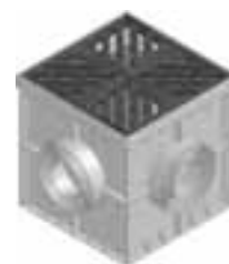
с чугунной решеткой "звезда", черн.