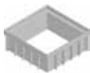
верхняя часть дождеприемника, из ПП, высота 120 мм