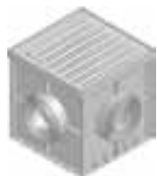
с ячеистой решеткой, MW 30/15, оцинк.сталь